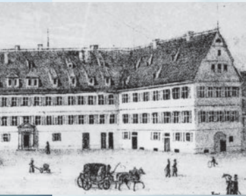
Schwörhof um 1845, heute Kanzleiplatz